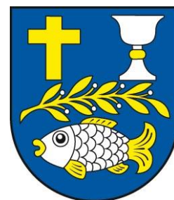
Obrázok 2 Erb obce

Erb obce Senné tvorí v modrom štíte hore zlatý latinský kríž a strieborný kalich so zlatým nodusom, pod nimi položená obrátená zlatá vavrínová vetvička so striebornými plodmi a dolu položená strieborná zlatoplutvá a zlatochvostá ryba.