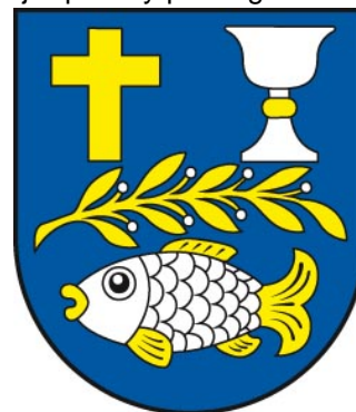
Obrázok 2 Erb obce

Erb obce Senné tvorí v modrom štíte hore zlatý latinský kríž a strieborný kalich so zlatým nodusom, pod nimi položená obrátená zlatá vavrínová vetvička so striebornými plodmi a dolu položená strieborná zlatoplutvá a zlatochvostá ryba. (Obrázok 2)