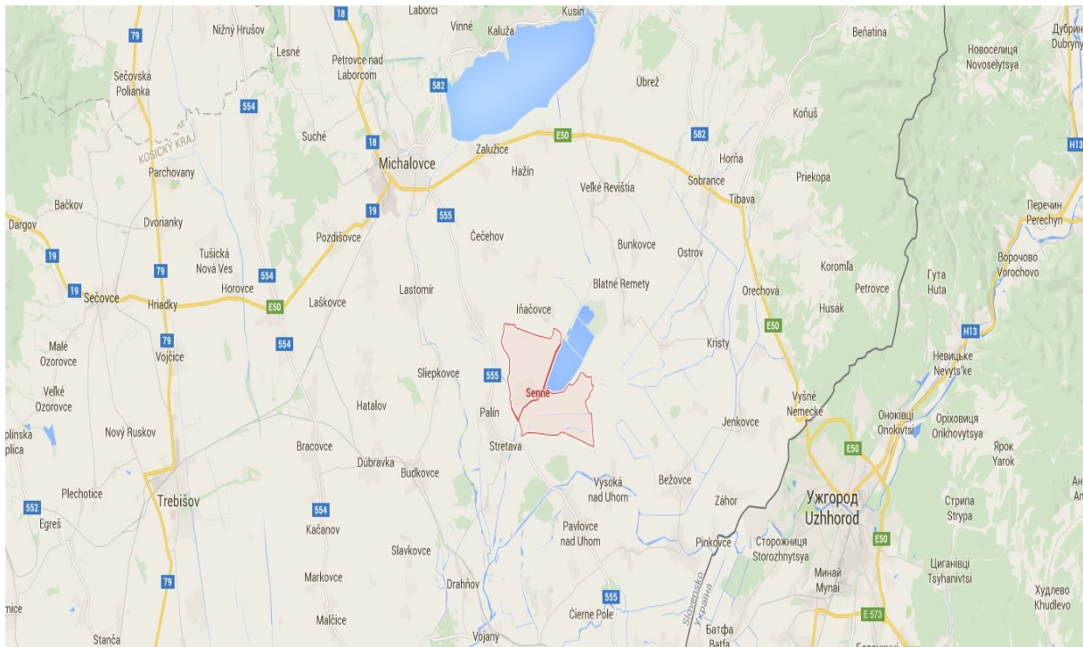
Obrázok 1 Mapa polohy obce Senné

Obec Senné sa nachádza na východe Košického kraja, južne od mesta Michalovce pri ceste III. triedy v smere z Michaloviec do obce Vojany neďaleko od štátnej hranice s Ukrajinou v nadmorskej výške 101 m. Seniansky chotár sa rozprestiera na Východoslovenskej nížine, na nánosovom vale Čiernej vody. Severozápadná časť územia obce je rovina s čiastočne sprášovými pôdami, východnú a južnú časť tvorí nevýrazná Senianska zníženina v zaplavovanom území Čiernej vody.